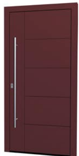
MS 10 Ud-Wert: 0,68 Farbe: FS Purple ca. RAL 3004