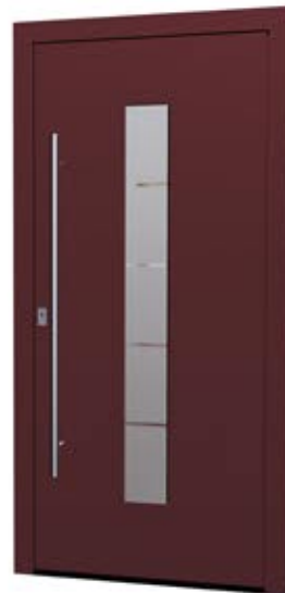
MS 04 Ud-Wert: 0,80 Farbe: FS Purple ca. RAL 3004