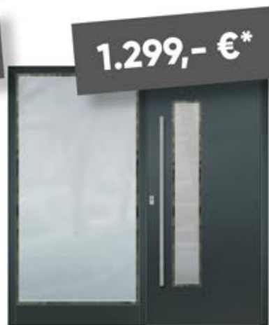
Seitenteil L Maße bis 800 x 2250 mm