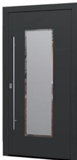
MS 08 Ud-Wert: 0,88 Farbe: MF Tiefschwarz, ca. RAL 9005