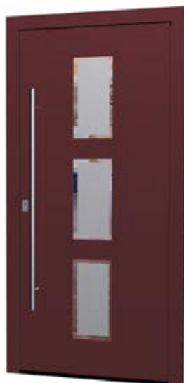
MS 07 Ud-Wert: 0,83 Farbe: FS Purple ca. RAL 3004