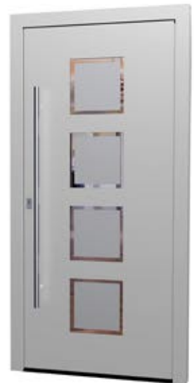
MS 05 Ud-Wert: 0,86 Farbe: RAL 9006 Weißaluminium matt