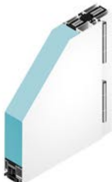
Innenansicht beidseitig flügelüberdeckend mit Rollentürbändern