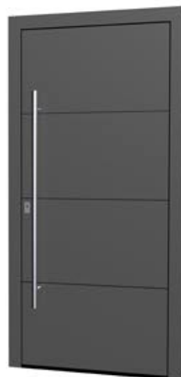
MS 09 Ud-Wert: 0,68 Farbe: Sparkling Iron, ca. RAL 9007