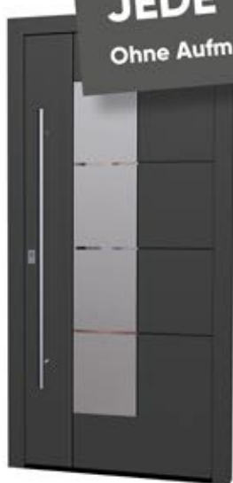
MS 01 Ud-Wert: 0,85 Farbe: MF Tiefschwarz, ca. RAL 9005

JEDE TÜR: 2.799,- €* Ohne Aufmaß, ohne Montage!