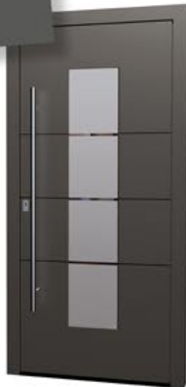
MS 03 Ud-Wert: 0,84 Farbe: MF Sparkling Iron, ca. RAL 9007