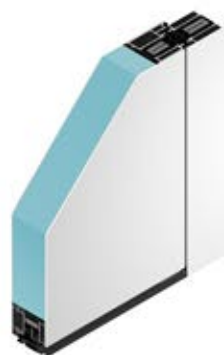
Außenansicht beidseitig flügelüberdeckend

Beidseitig flügelüberdeckende Füllung, 92 mm Gesamtstärke UD-Wert = 0,67 W/m 2 K (Berechnungsbasis DIN EN ISO 10077-1, Tür 1200 x 2250 mm mit komplett geschlossener Türfüllung, ohne Glas)