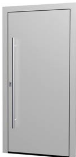
MS 06 Ud-Wert: 0,68 Farbe: RAL 9006 Weißaluminium matt