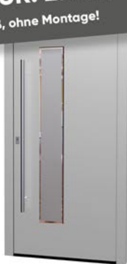
MS 02 Ud-Wert: 0,81 Farbe: RAL 9006 Weißaluminium matt